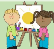
Klipp og lim* 15.00-16.00