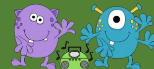
Michael Jackson-dans* 14.30-15.30